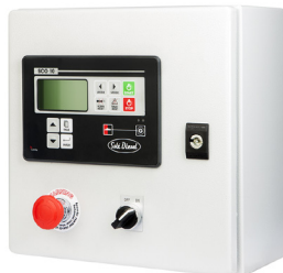
Kit Armario IP 65